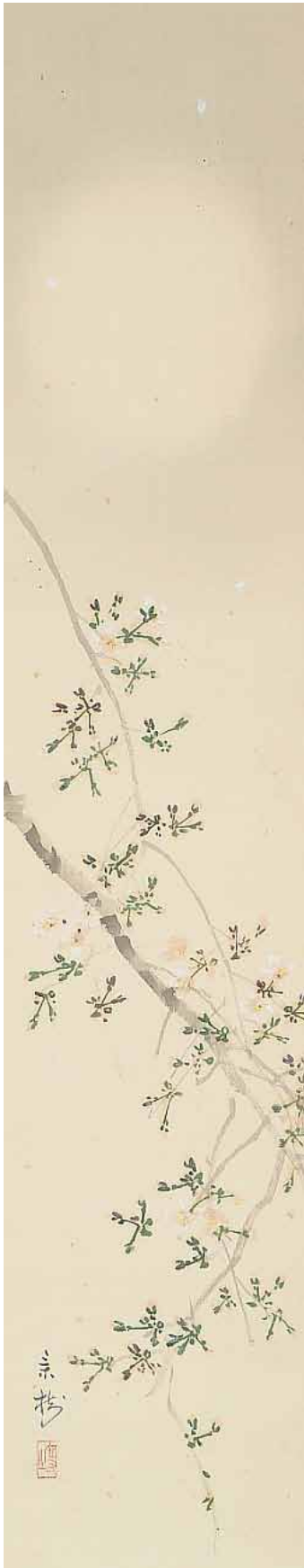
今井景樹筆桜図掛幅